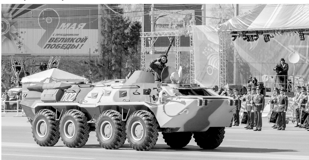
Всего в параде приняло участие 47 единиц боевой техники.