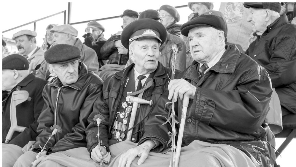
Ветераны могли смотреть парад с трибун, где по случаю весьма прохладной погоды зрителям выдали одеяла.