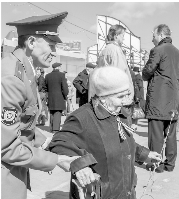
Сегодня в Новосибирской области проживает 5300 участников Великой Отечественной. Самому младшему из них исполнилось 86 лет.