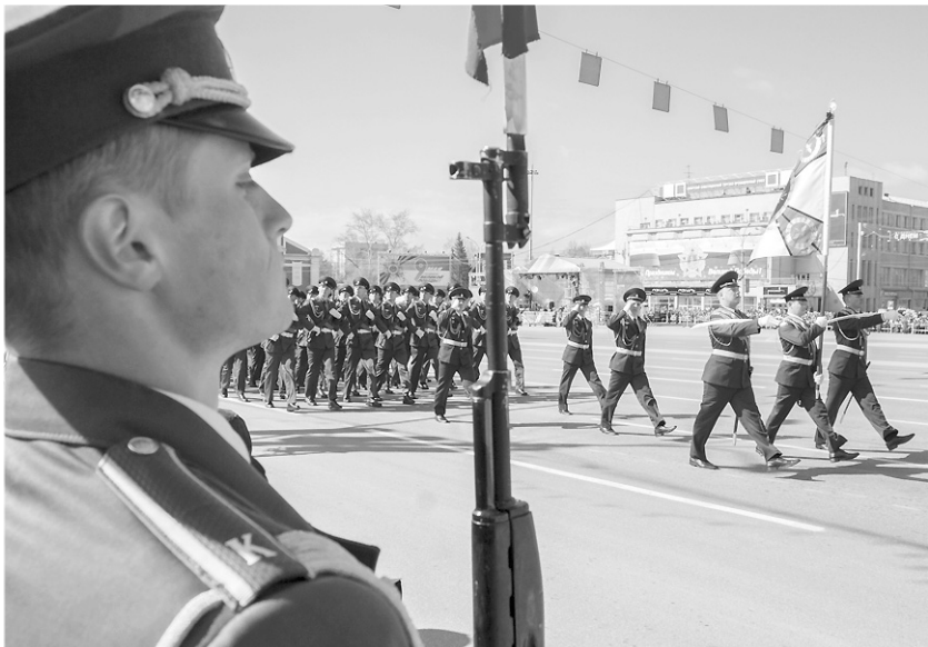
По площади Ленина 9 Мая прошло порядка 1000 военнослужащих разных родов войск.