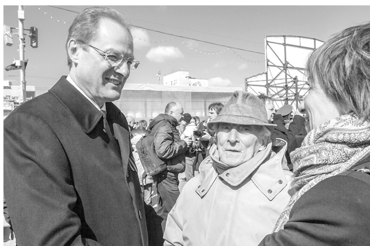
Глава Новосибирской области Василий Юрченко отметил: «С каждым годом День Победы становится всё более трогательным праздником. К сожалению, всё меньше остаётся с нами участников Великой Отечественной войны. Но память об их героизме будет сохраняться всегда...»