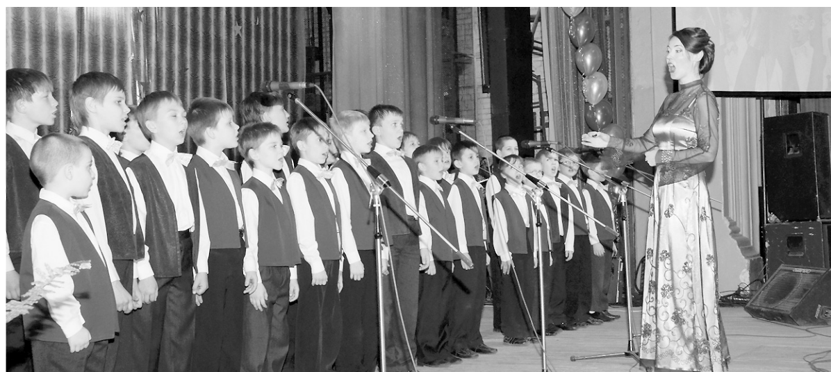
Образцовый коллектив Детская хоровая студия «Дружба» по итогам 2011 года удостоен звания лауреата конкурса «Золотая книга Новосибирской области» в номинации «коллектив года».

Как она умела зазвучать детей песней, дать прочувствовать её сердцем, услышать глубинные интонации, мы смогли увидеть однажды сами. Несколько лет назад я готовилась к съёмкам документального фильма в серии «Сибирская энциклопедия» для ГТРК «Новосибирск» о стране фантазии, которую придумали