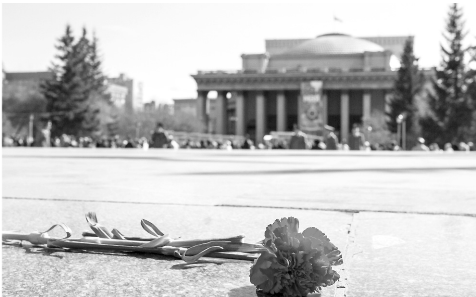
Центральным событием празднования Дня Победы в нашей области традиционно стал парад, посвящённый 67-й годовщине Победы в Великой Отечественной войне 1941—1945 гг.

Особенностью этого парада стало участие в нём знаменитой группы Президентского полка, которая пронесла по площади официальную копию Знамени Победы.